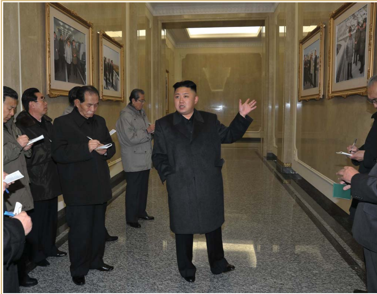
금수산태양궁전을 태양의 성지답게 훌륭히 꾸리기 위한 방향과 방도를 밝혀주시는 경애하는 김정은동지

력사적인 당중앙위원회 제8기 제3차전원회의의 연단에서 경애하는 김정은동지께서는 우리 당은 견인불발의 투지로 혁명앞에 가로놓인 현 난국을 반드시 헤칠것이며 앞으로 그 어떤 더 엄혹한 시련이 막아나서도 추호의 변심없이 위대한 수령님과 위대한 장군님의 혁명사상과 위업에 끝까지 충실할것이라는것을 당중앙위원회를 대표하여 엄숙히 선서하시였다. 오늘 조국땅 그 어디에서나 경애하는 총비서동지의 현명한 령도밑에 위대한 수령님과 위대한 장군님의 사상과 혁명위업이 한치의 드림도 없이 계승되고 완성되여가고있다.