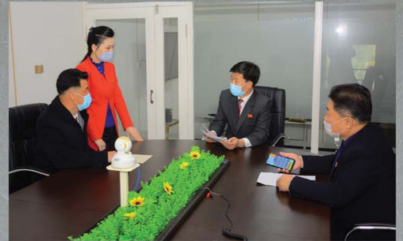
의뢰인들과의 상담을 진행한다.