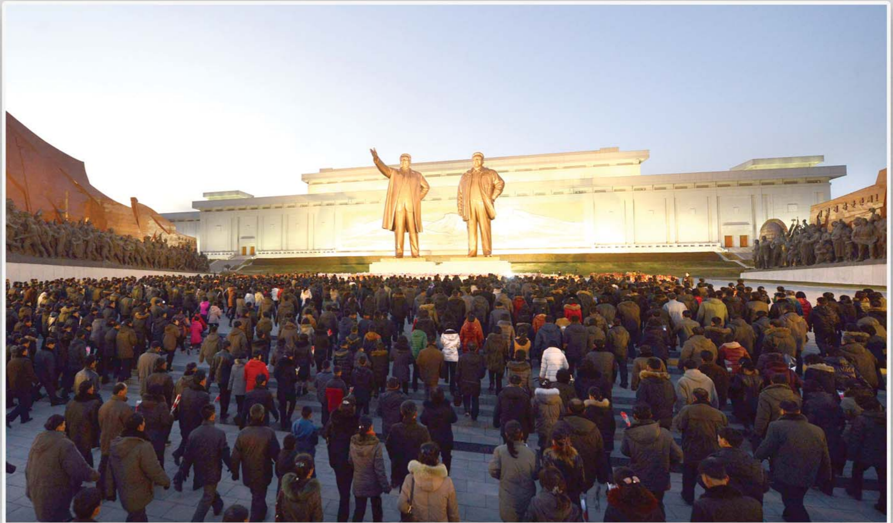
만수대언덕에 높이 모신 위대한 수령 김일성동지와 위대한 령도자 김정일동지의 동상을 찾는 각계층 근로자들 주체108(2019)년 촬영