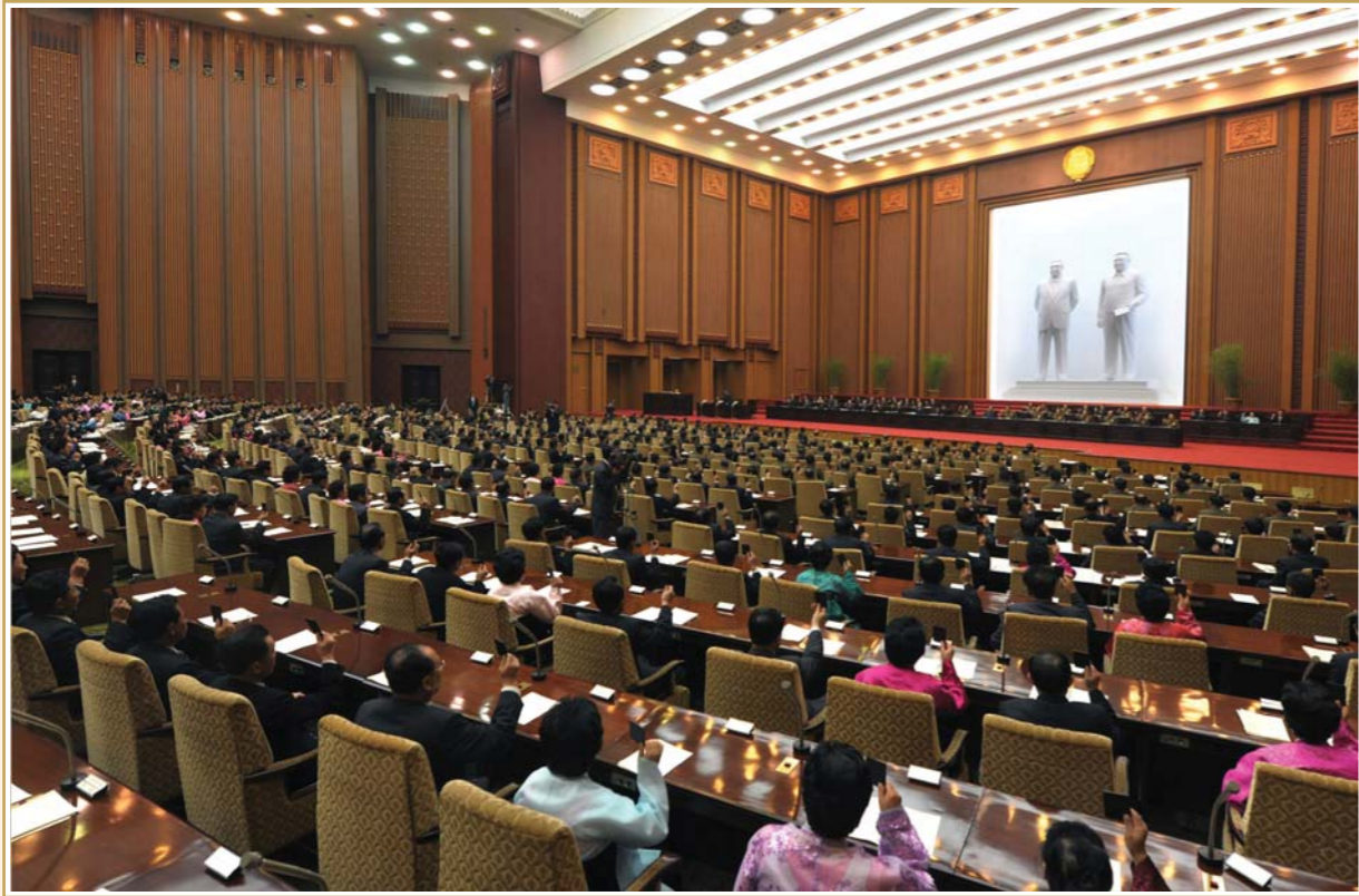
경애하는 김정은동지를 모시고 진행된 조선민주주의인민공화국 최고인민회의 제12기 제7차 회의에서는 조선민주주의인민공화국 최고인민회의 법령으로 금수산태양궁전법이 채택되었다.