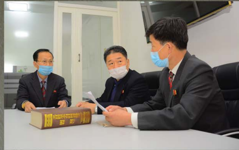
사건처리에서의 과학성, 객관성, 공정성을 보장한다.

조선변호사회 통남산법률사무소는 공화국국민들과 외국인들을 대상으로 활동하는 종합적인 법률봉사기관이다.