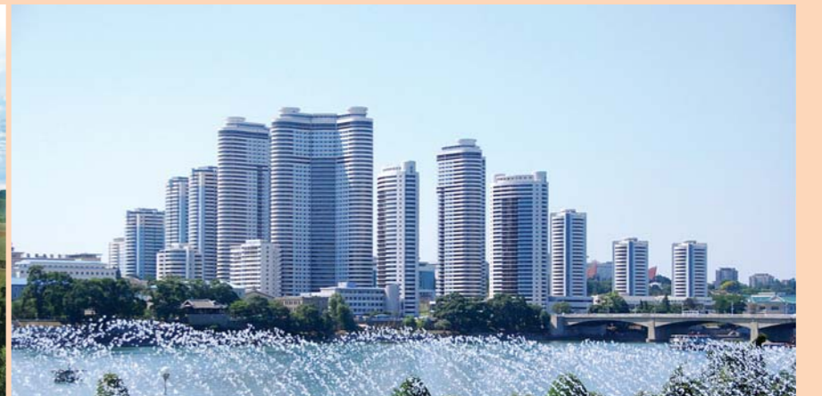
조국땅에 마련된 귀중한 재부들과 창조물들은 위대한 장군님께서 인민의 행복을 위하여 남기신 고귀한 유산으로 되고있다.