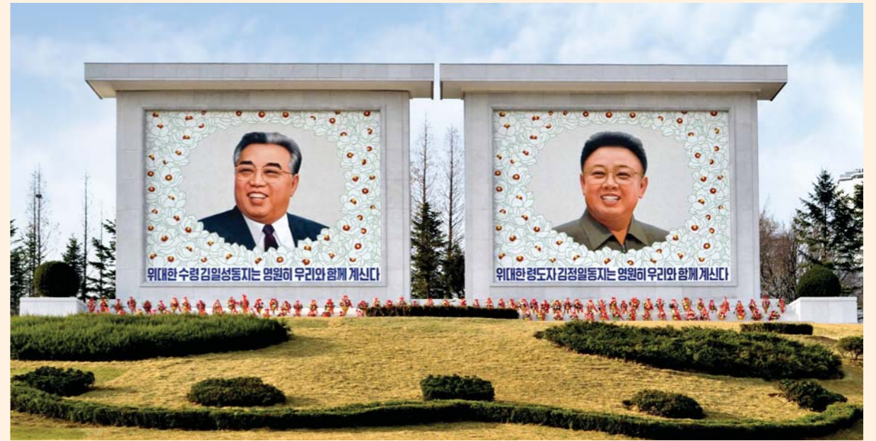
위대한 수령 김일성동지와 위대한 령도자 김정일동지의 태양상모자이크벽화를 평양의 장대재언덕에 모시었다.