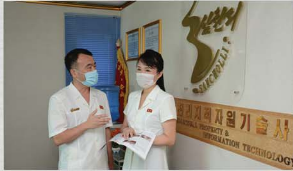
기술사사업에 대하여 토의한다.

지식경제시대인 오늘날 세계적으로 자연부원과 에너지자원이 급속히 고갈되어가고있는 반면에 지적자원은 마를줄 모르는 샘처럼 끊임없이 창조되고있다.