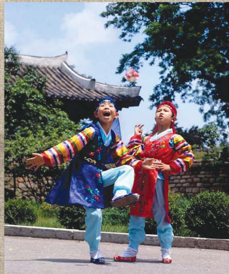
로 제기차기를 해야 하는것만 년 5월 국가비물질문화유산으로 등록되었습니다.

제기차기는 어린이들에게 집중력과 물체의 자유락하에 대한 정확한 판단력을 키워주며 온몸놀림을 기본으로 하는 운동으로서 주로 한발로 온몸의 중심을 유지하고 다른 발