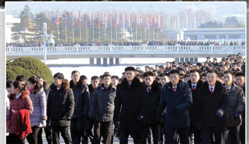
금수산태양궁전을 찾는 근로자들 주체108(2019)년 촬영

중앙동물원, 룡악산샘물공장, 평양남새과학연구소, 평양화초연구소, 희천발전소건설장, 대동강과수종합농장, 개선