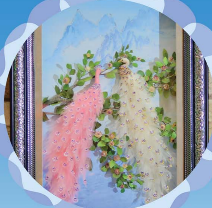
글 본사기자 엄향심