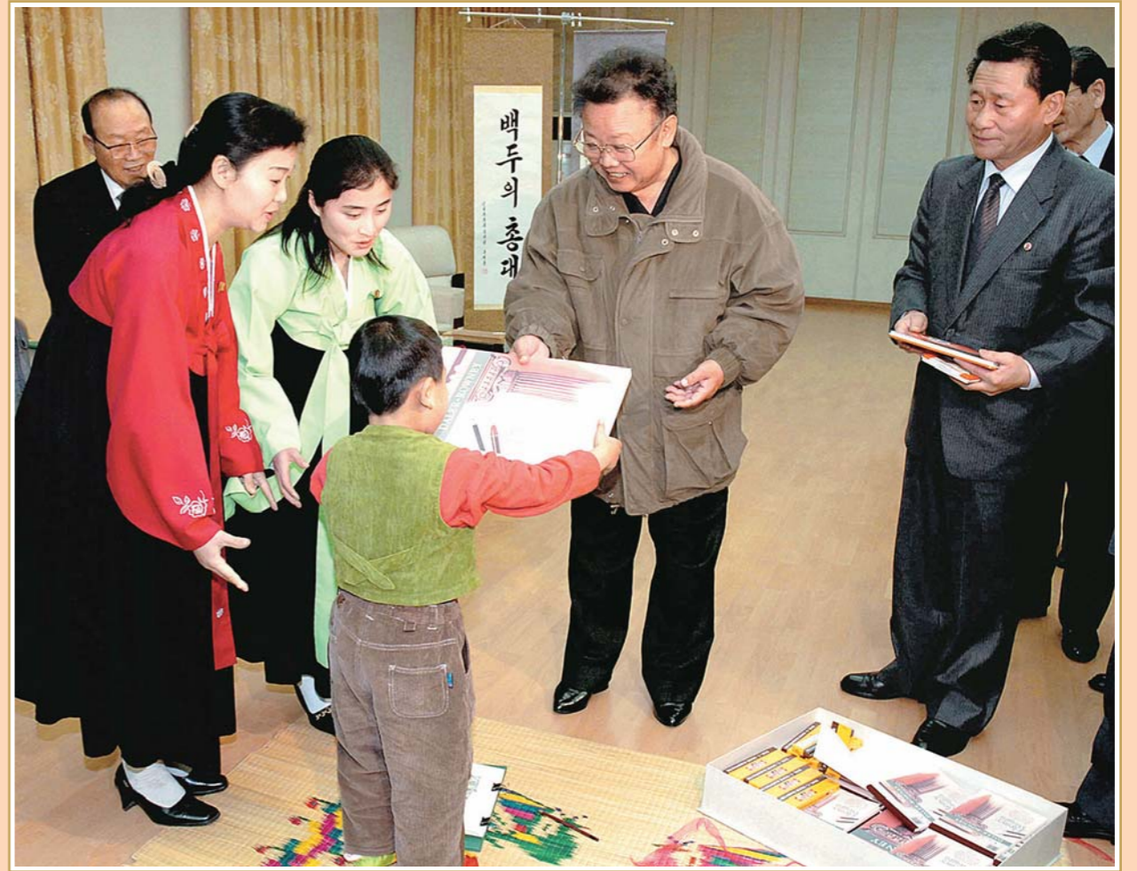
신의주시 본부유치원 어린이들이 창작한 서예와 그림을 보아주시고 그들의 앞날을 축복해주는 위대한 령도자 김정일동지 주체95(2006)년 1월

아무리 세월이 흐르고 산천이 변해도 위대한 령도자 김정일동지에 대한 조국인들의 그리움은 날이 갈수록 더욱더 강렬해만 진다.