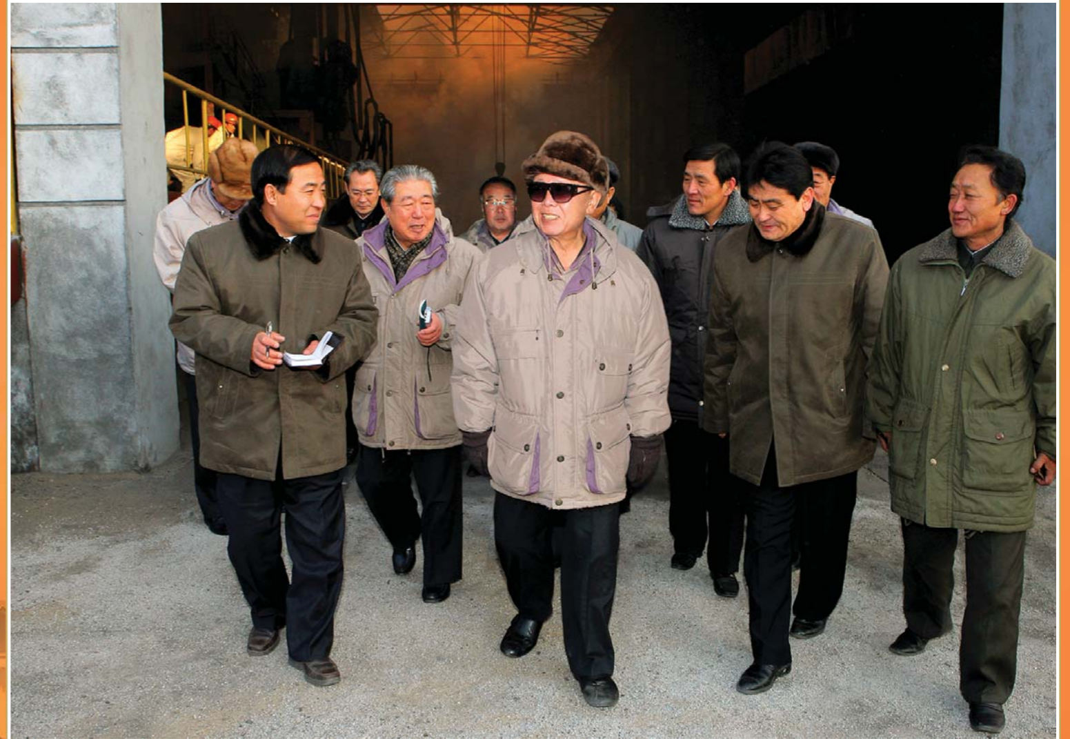
주체철생산체계를 완성한 기업소를 현지지도하시는 위대한 령도자 김정일동지 주체98(2009)년 12월

위대한 생애의 마지막시기까지 현지지도하신 단위 1만 4 290여개 현지지도하신 총 거리 연 167만 4 610여리