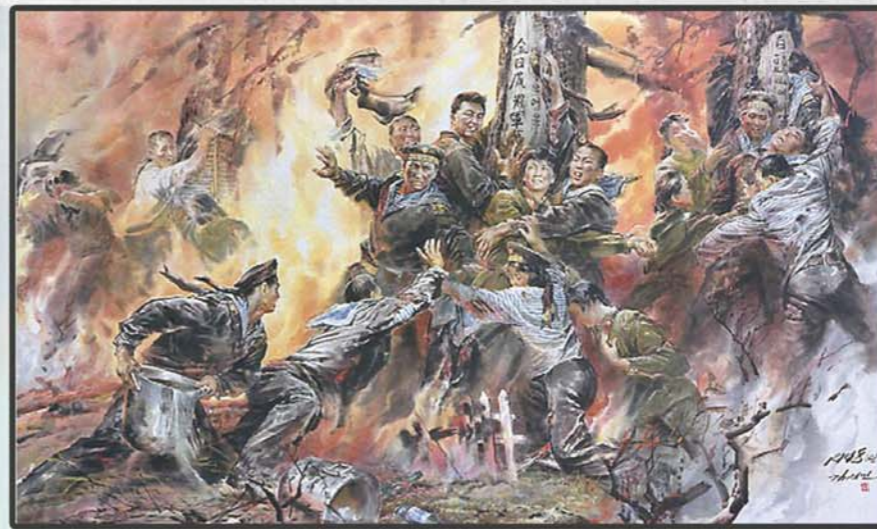
조선화 《90년대의 불사조들》