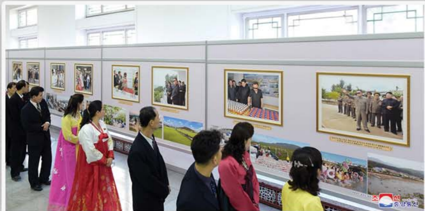
그리움의 마음을 담아