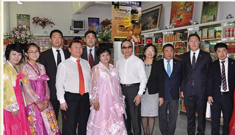
주체103(2014)년 몽골대표단과 함께