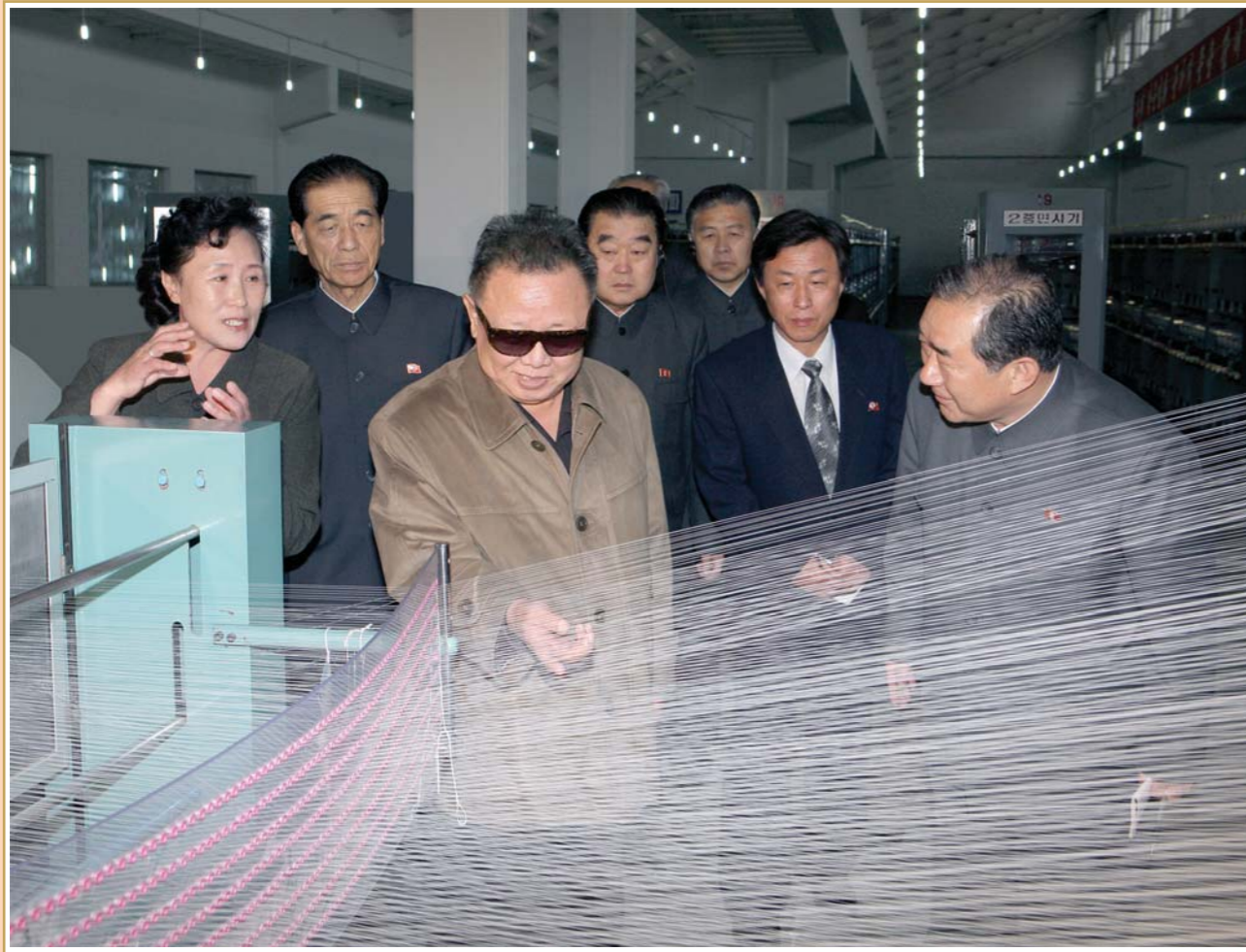
평양방직공장을 현지지도하시는 위대한 령도자 김정일동지 주체100(2011)년 5월