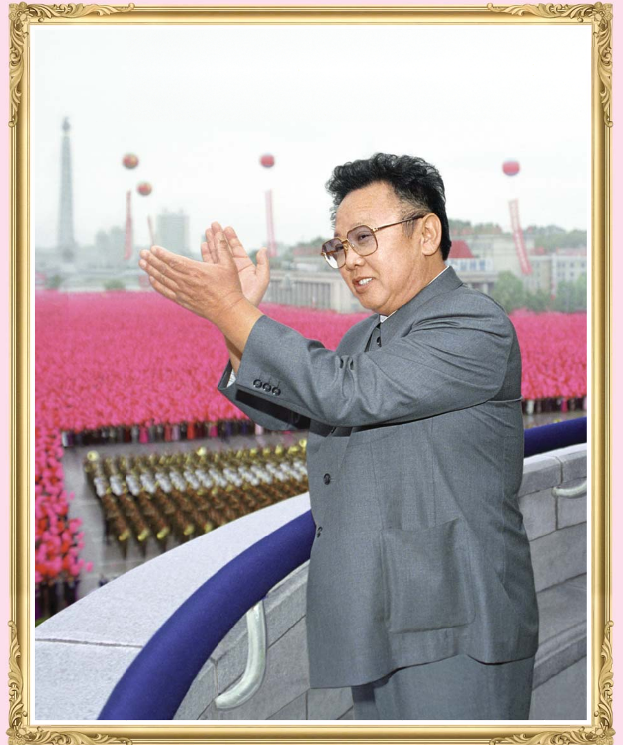
인민들의 열광적인 환호에 답례하시는 위대한 령도자 김정일동지 주체89(2000)년 10월