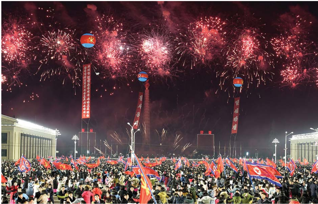
당 제8차대회기념 열병식이 성대히 진행되는데 이어 축포발사가 있었다.