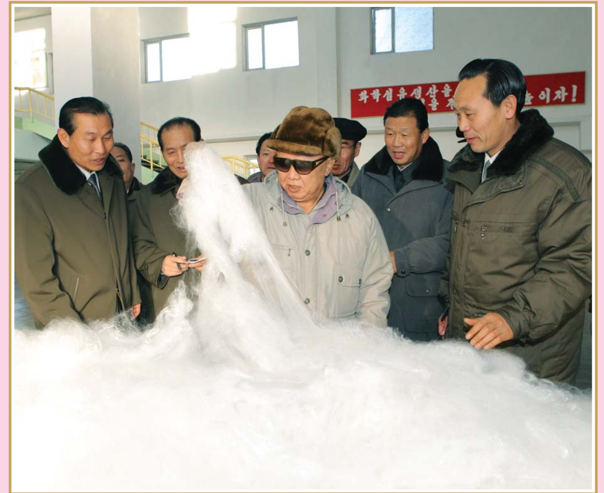
2.8비날론련합기업을 찾으시어 비날론솜을 보아주시는 위대한 령도자 김정일동지 주체100(2011)년 1월