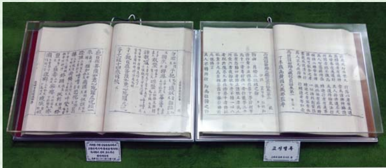
고려종이에 인쇄한 《팔만대장경》과 《교정별록》

해외에 계시는 동포여러분, 민족의 역사와 문화에 대한 폭넓은 상식을 주는 《민족의 향기》란입니다.