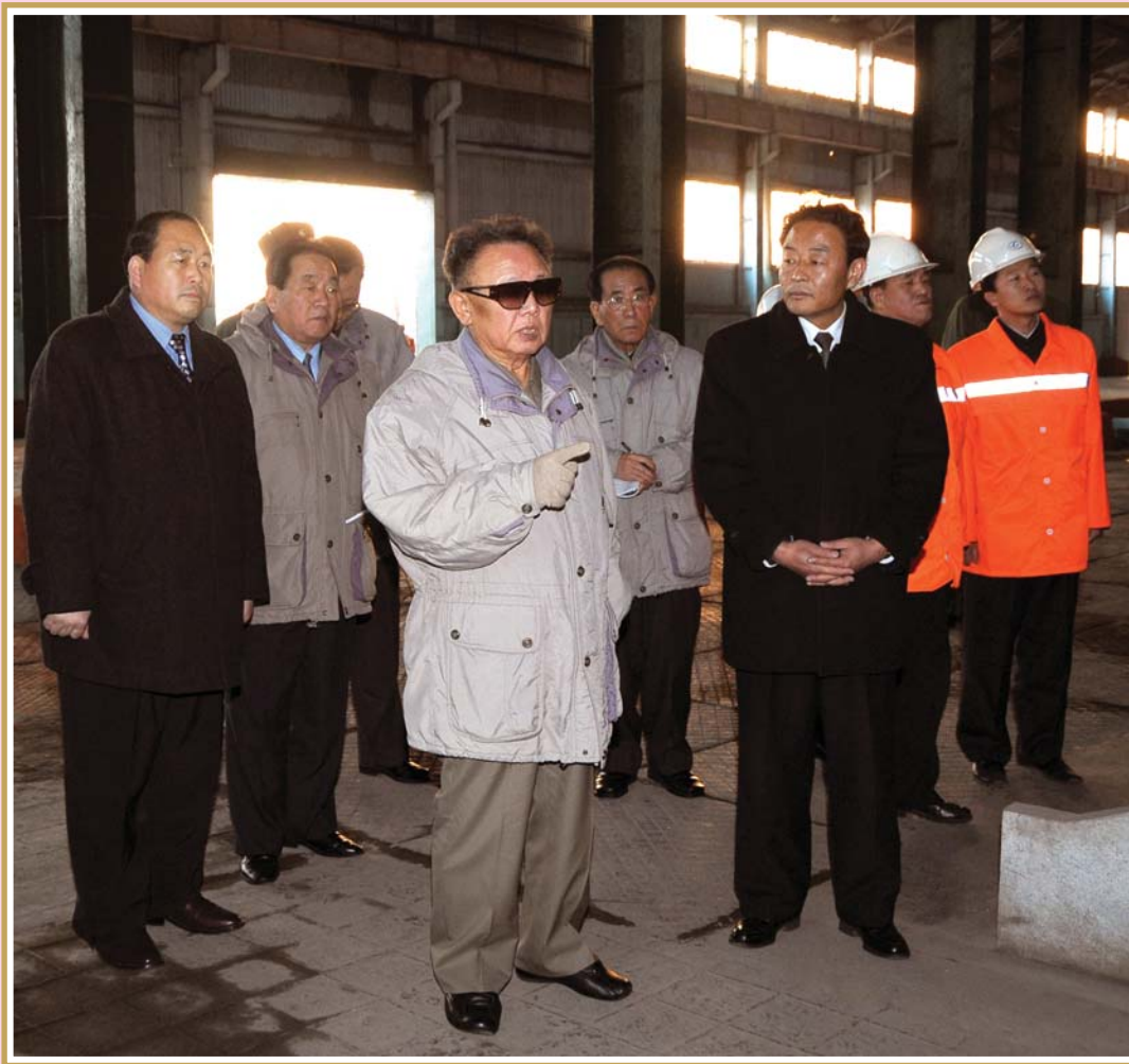
천리마제강련합기업을 현지지도하시면서 새로운 혁명적대고조의 불길을 지펴주시는 위대한 령도자 김정일동지 주체97(2008)년 12월