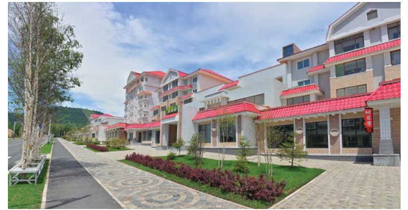
인민군군인들이 건설한 삼지연시의 일부