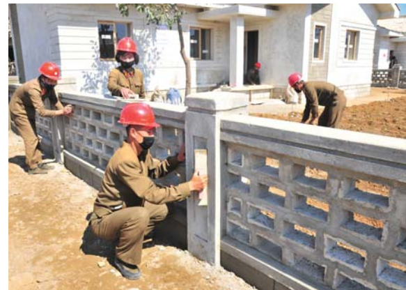
피해복구건설에서 헌신의 땀을 바쳐가고있는 인민군군인들 주체109(2020)년 10월 촬영