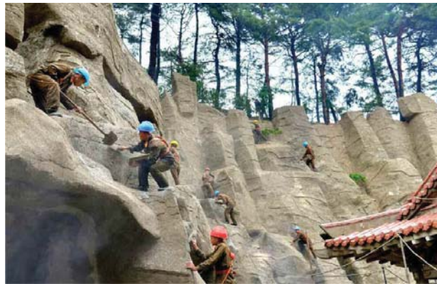
인민군군인들이 건설한 양덕온천문화휴양지 주체108(2019)년 촬영