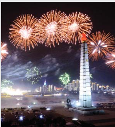
뒤표지: 경축의 축포

위대한 령도자 김정일동지께서 주체31(1942)년 2월 16일 백두광명성으로 탄생하신 이 력사의 집으로 국내인민들은 물론 외국인들과 해외동포들이 끝없이 찾아온다.