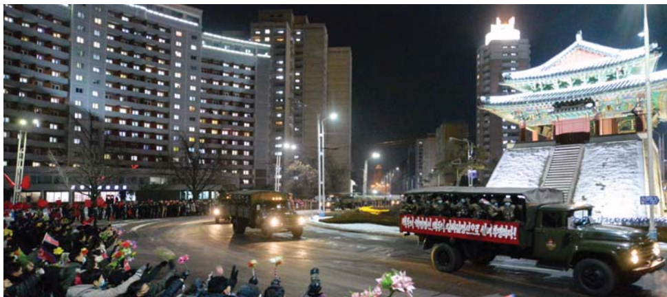
평양시민들의 열렬한 환영속에 수도의 거리를 통과하고있는 조선로동당 제8차대회기념 열병식참가자들