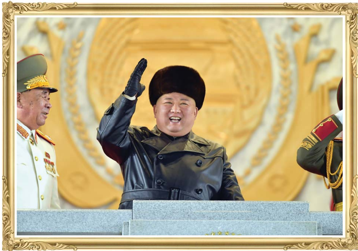
열광의 환호를 올리는 열병대원들과 관중들에게 손저어 답례하시는 경애하는 김정은동지

지난 1월 14일 수도 평양의 김일성광장에서 조선로동당 제8차대회기념 열병식이 거행되었다.